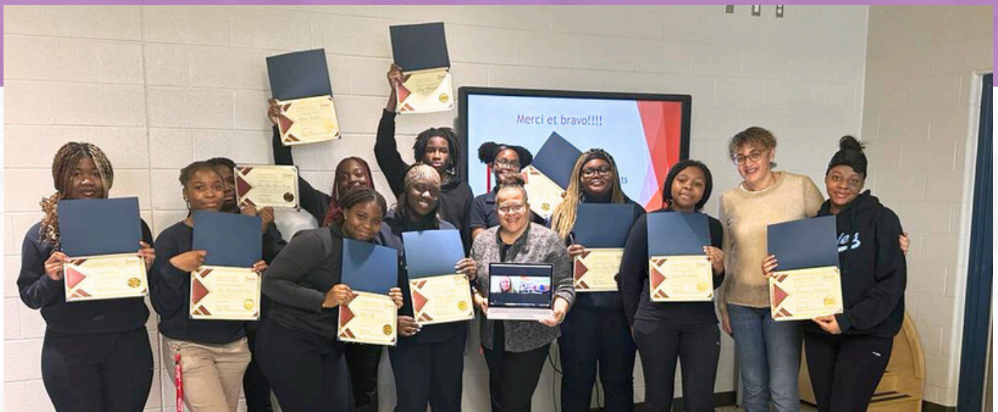
Photos prises à l'école secondaire catholique Père-Philippe-Lamarche